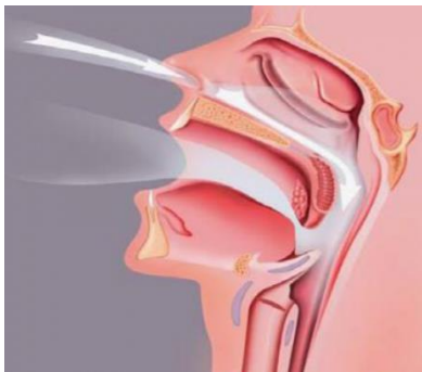
Figuur 1: Onderste neusslijmvliezen

Deze hebben de grootte van een pink en bevinden zich horizontaal in beide doorgangen van uw neus. Deze onderste neusschelpen kunnen opzwellen. Aan de oppervlakte staan kleine haartjes die de ingeademde lucht zuiveren van stofjes terwijl het slijmvlies ook de lucht bevochtigt.