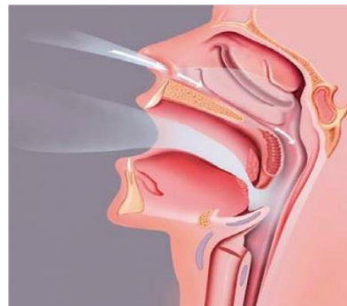
Figuur 2: Vergrote neusslijmvliezen